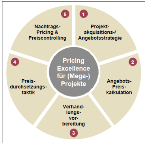
Abbildung 1: Pricing Excellence-Ansatz für (Mega-)Projekte

Diese Grafik ist übersichtlich, gut strukturiert und in einem Farbschema gehalten. So ähnlich könnten auch die Grafiken zu Ihrem Beitrag aussehen.